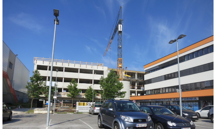
MSC-Gebäude ab Frühjahr 2014

Der Sitz des Hilfswerk Neunkirchen befindet sich derzeit im 1. Stock in der Triesterstraße 29. Im Frühjahr 2014 wird in das neue MSC-Gebäude am Spitz übersiedelt.