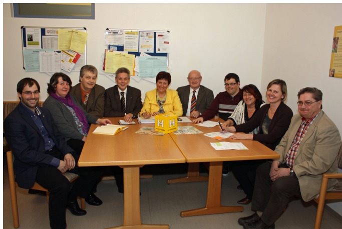
Vorstand aus dem Jahr 2012