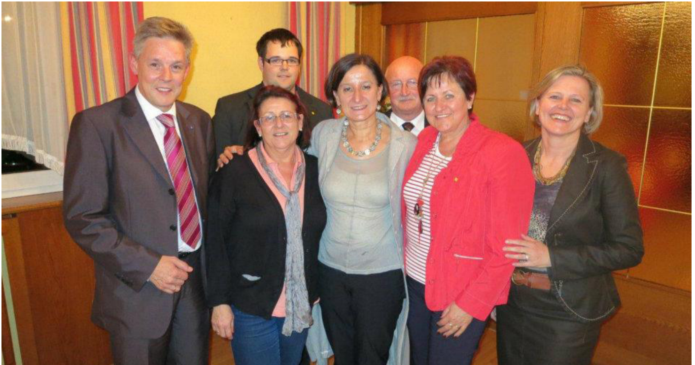
Sicherheitstag Neunkirchen mit Innenministerin Johanna Mikl-Leitner (2012)