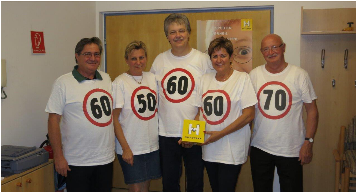
300. Geburtstag im Vorstand des Hilfswerk Neunkirchen (2012)