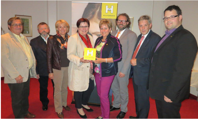
Regionalkonferenz in Wr. Neustadt (2013)