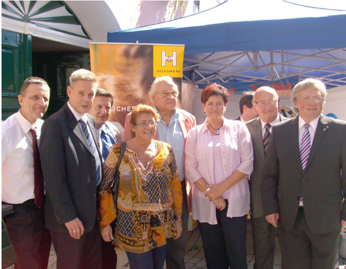
Stadtfest Neunkirchen (2010)