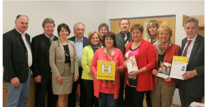
Bürgermeistertreffen im Hilfswerk Neunkirchen (2013)