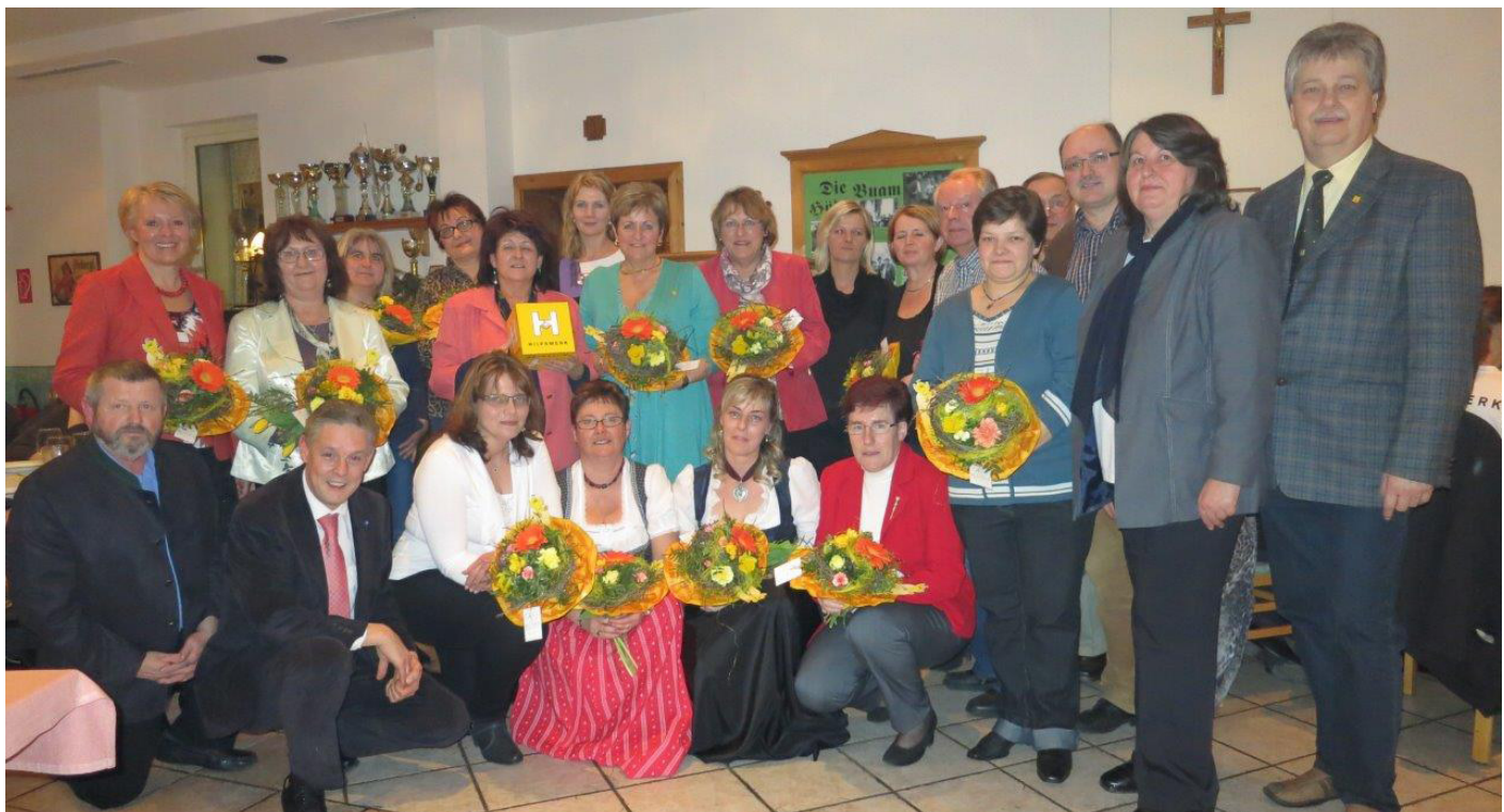
Frühlingsfest im Gasthaus Zwinz Schneebergdörfel (2013)

Tagesmütter und Mobile Mamis von Hilfswerk kochten zum „Tag der Tagesmütter“ gemeinsam mit Seminarbäuerinnen in der Kirchküche der Bezirksbauernkammer Neunkirchen.