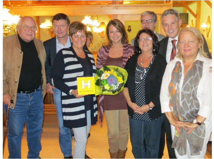
Stammtisch Neunkirchen (2013)