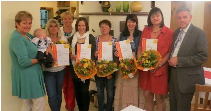
Feier anlässlich der Tagesmütter-Qualitätszertifikate im Gasthaus Reisenbauer