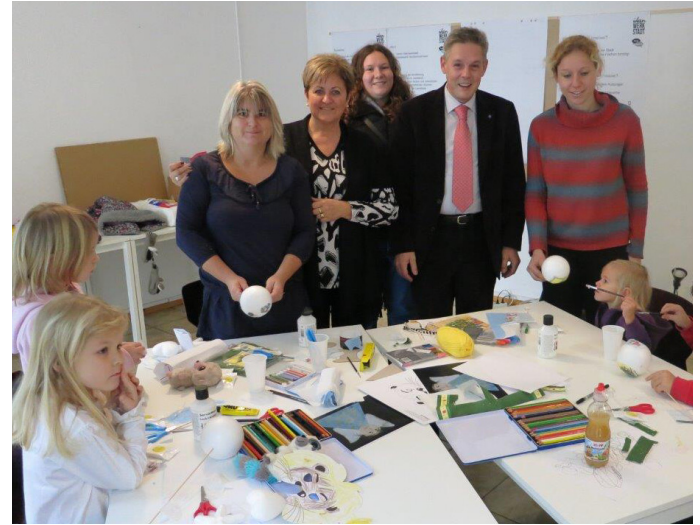
Kinderbetreuung beim Stadtfest Neunkirchen (2010)