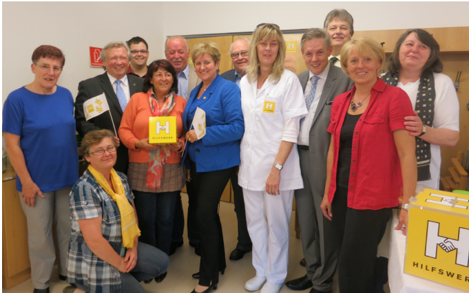
Tag des Hilfswerk (2013)