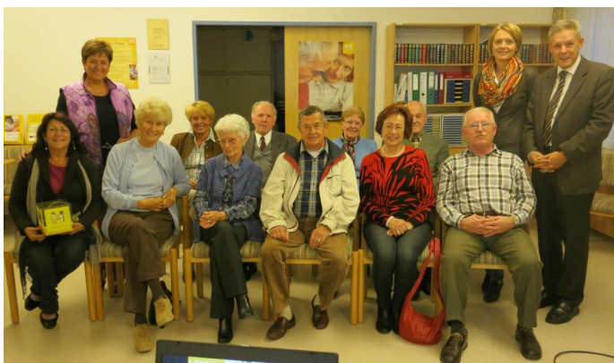
Vortrag zum Thema Demenz (2012)