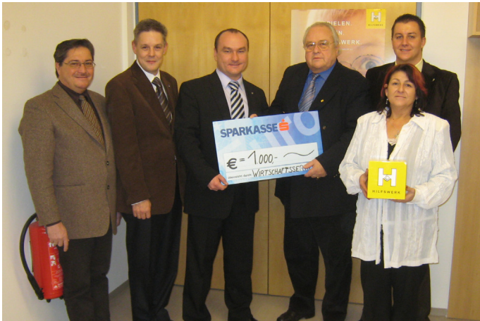
Spendenübergabe Sparkasse (2007)