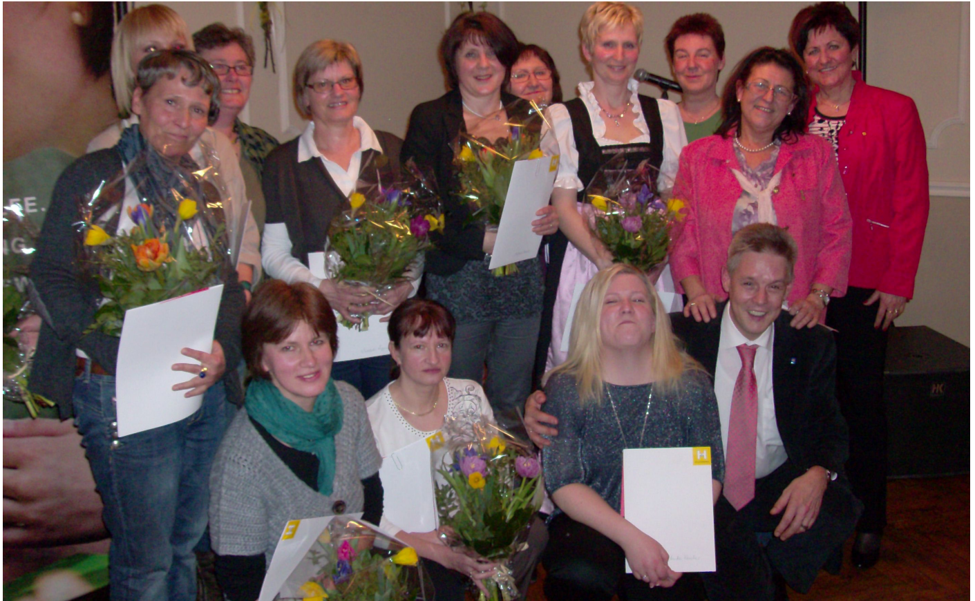
Frühlingsfest im Gasthaus Manhalter Pitten (2012)