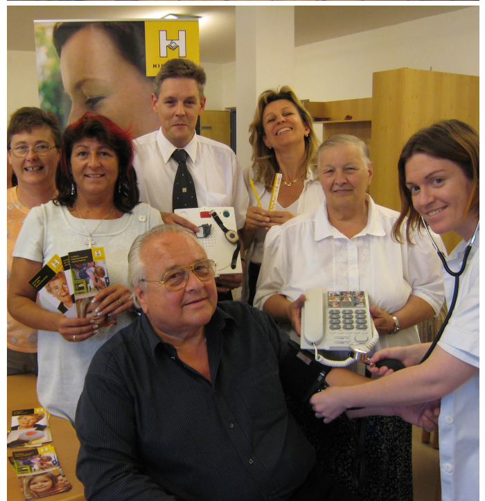
Gesundheitscheck am Tag des Hilfswerk (2007)