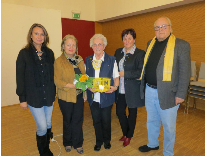
Stammtisch Baden (2012)