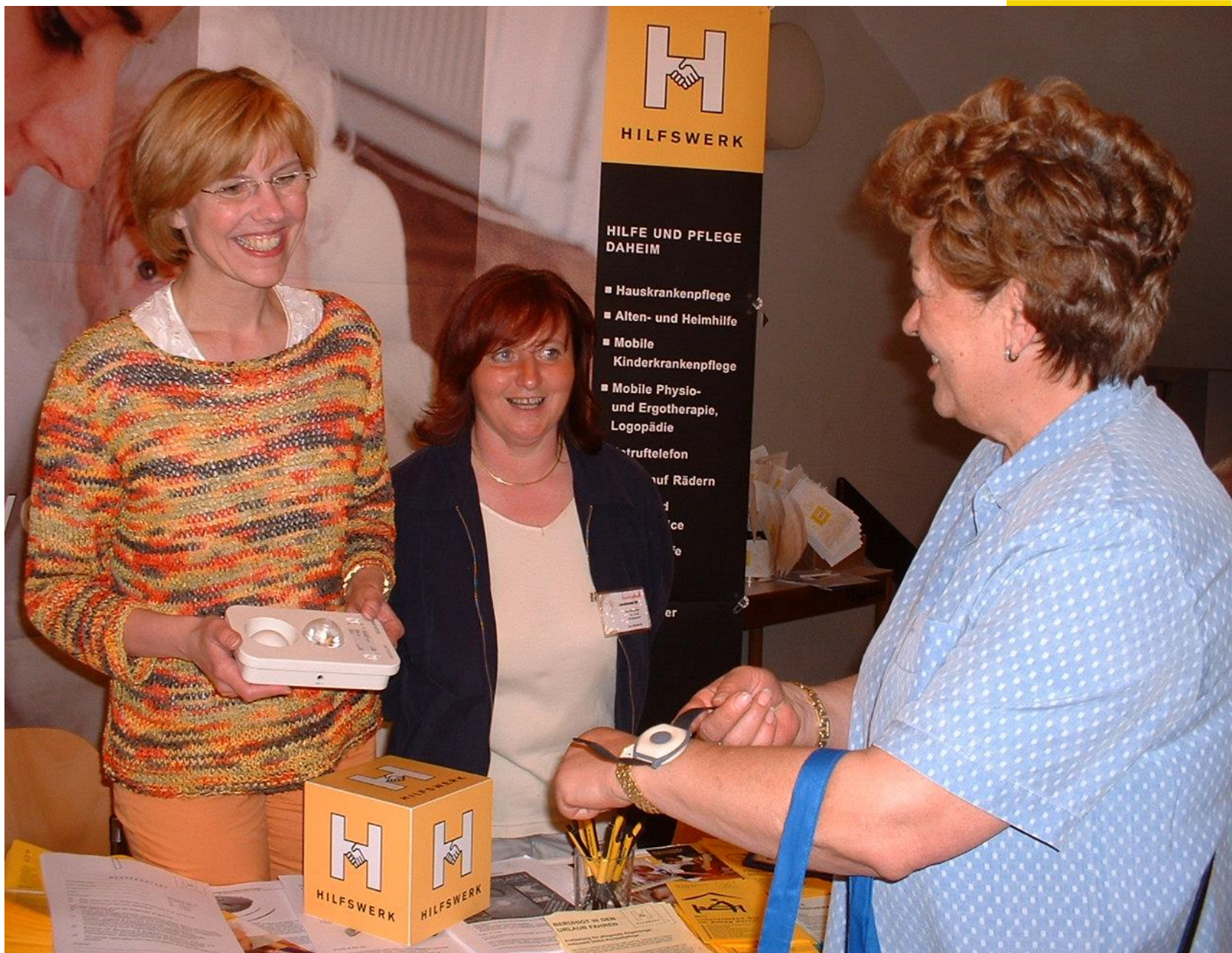
NÖ Diabetikertag in Tulln am 2. Mai 2004