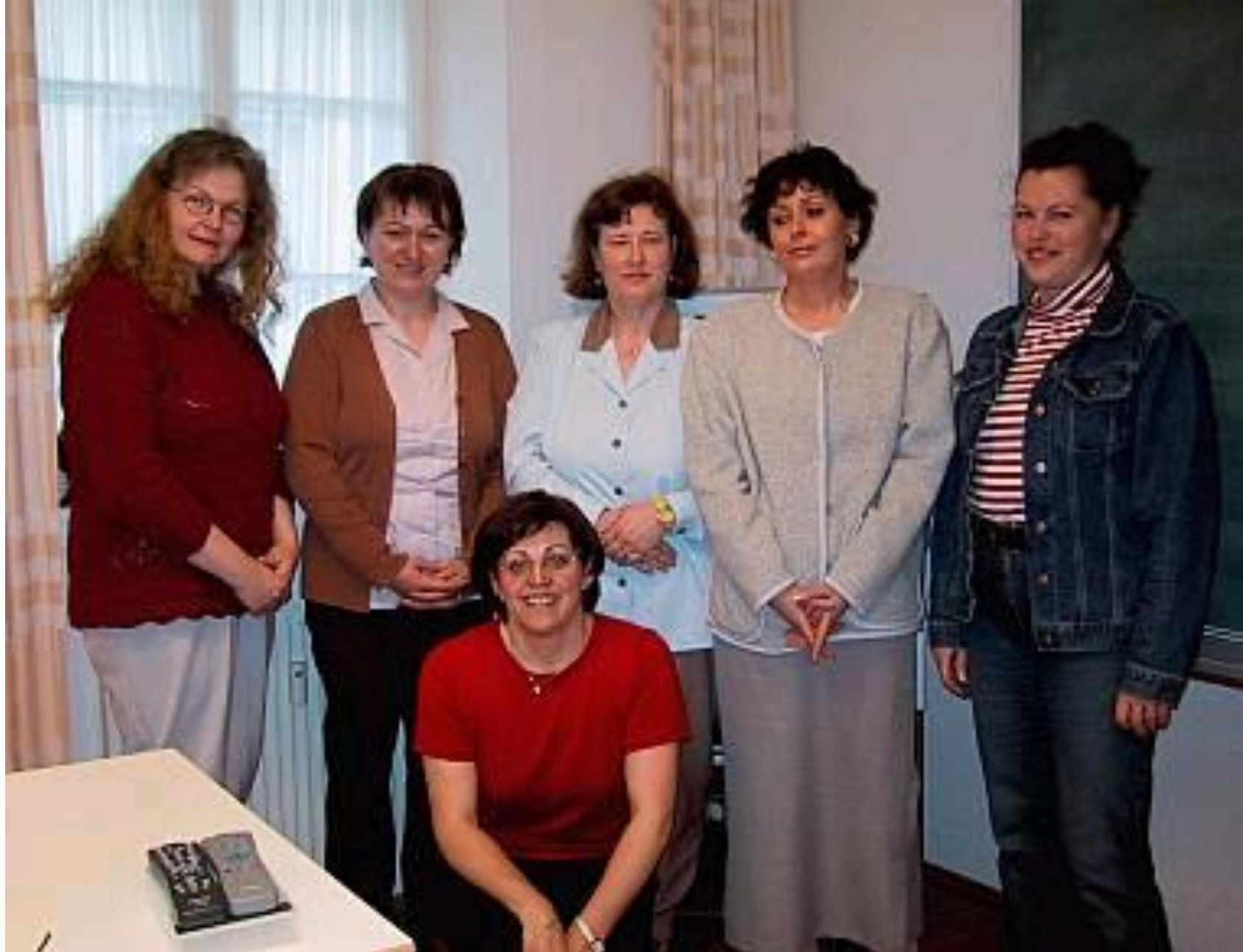
Unser Team Kinder, Jugend & Familie