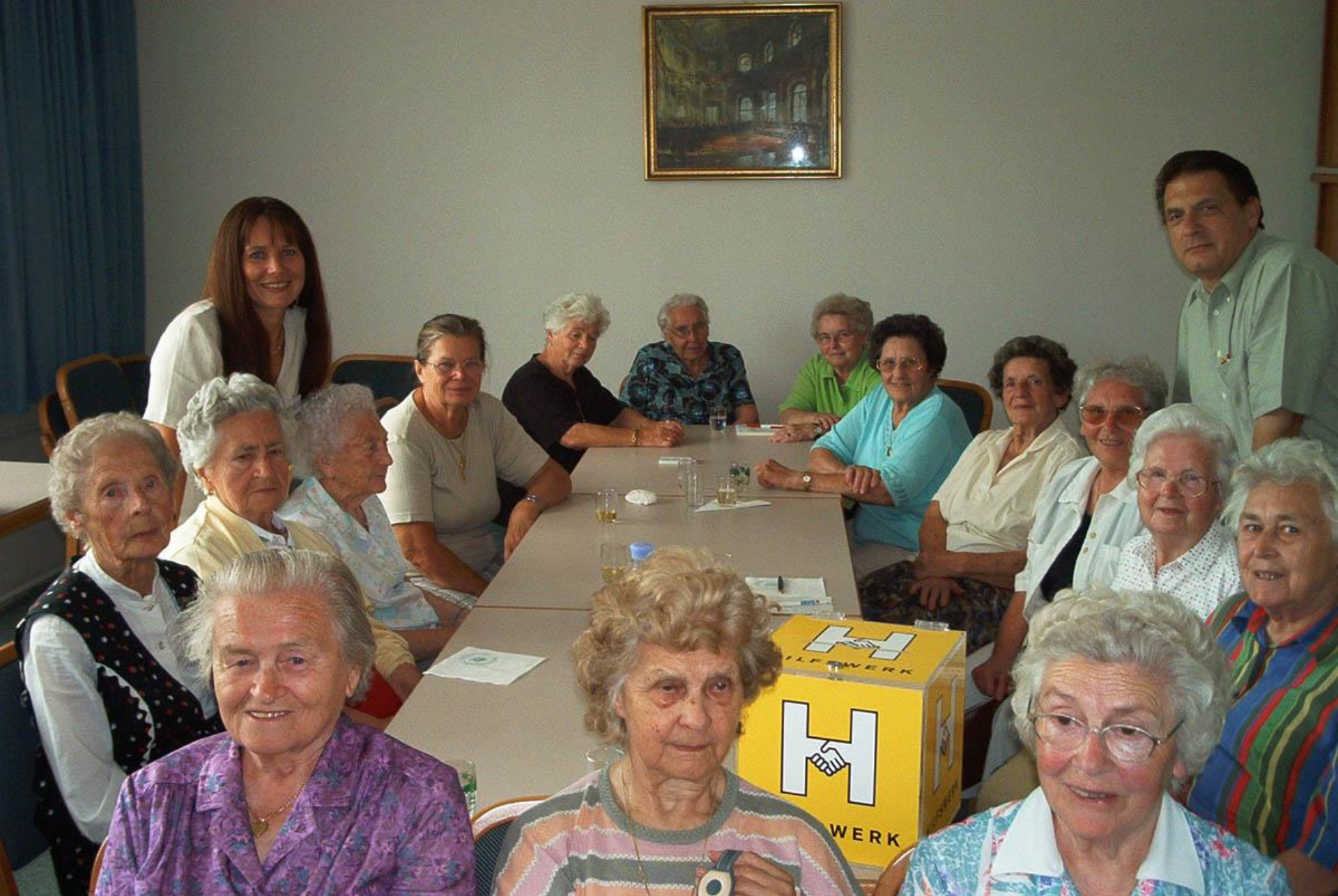
Besuch der Seniorenrunde in Langenlebarn Sommer 2003