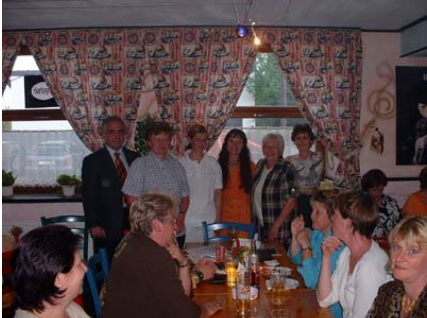
Langenlebarn am 3. Mai 2004