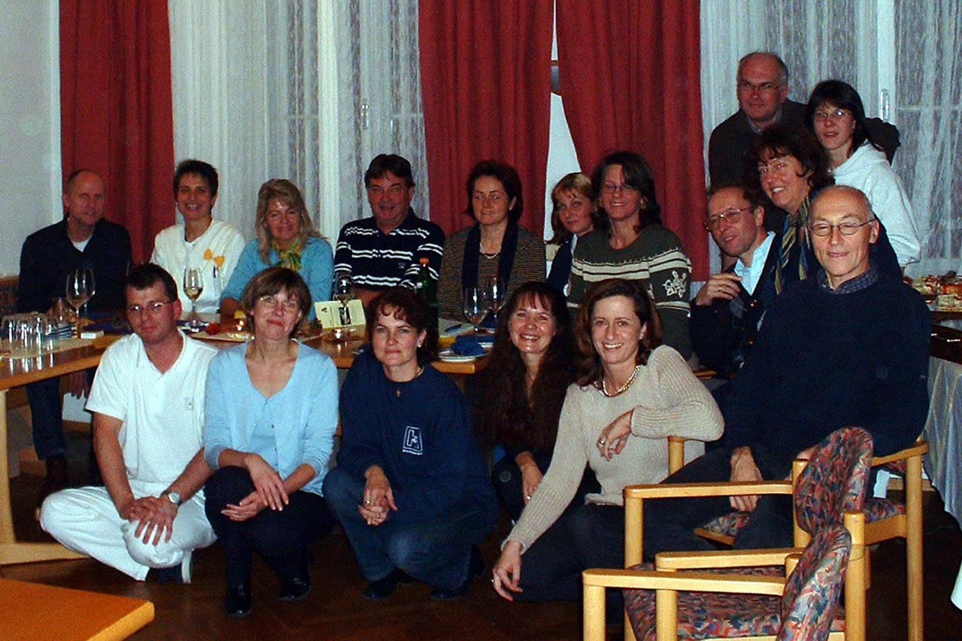
Ärztetreffen Tulln am 4. November 03 in der Sozialstation