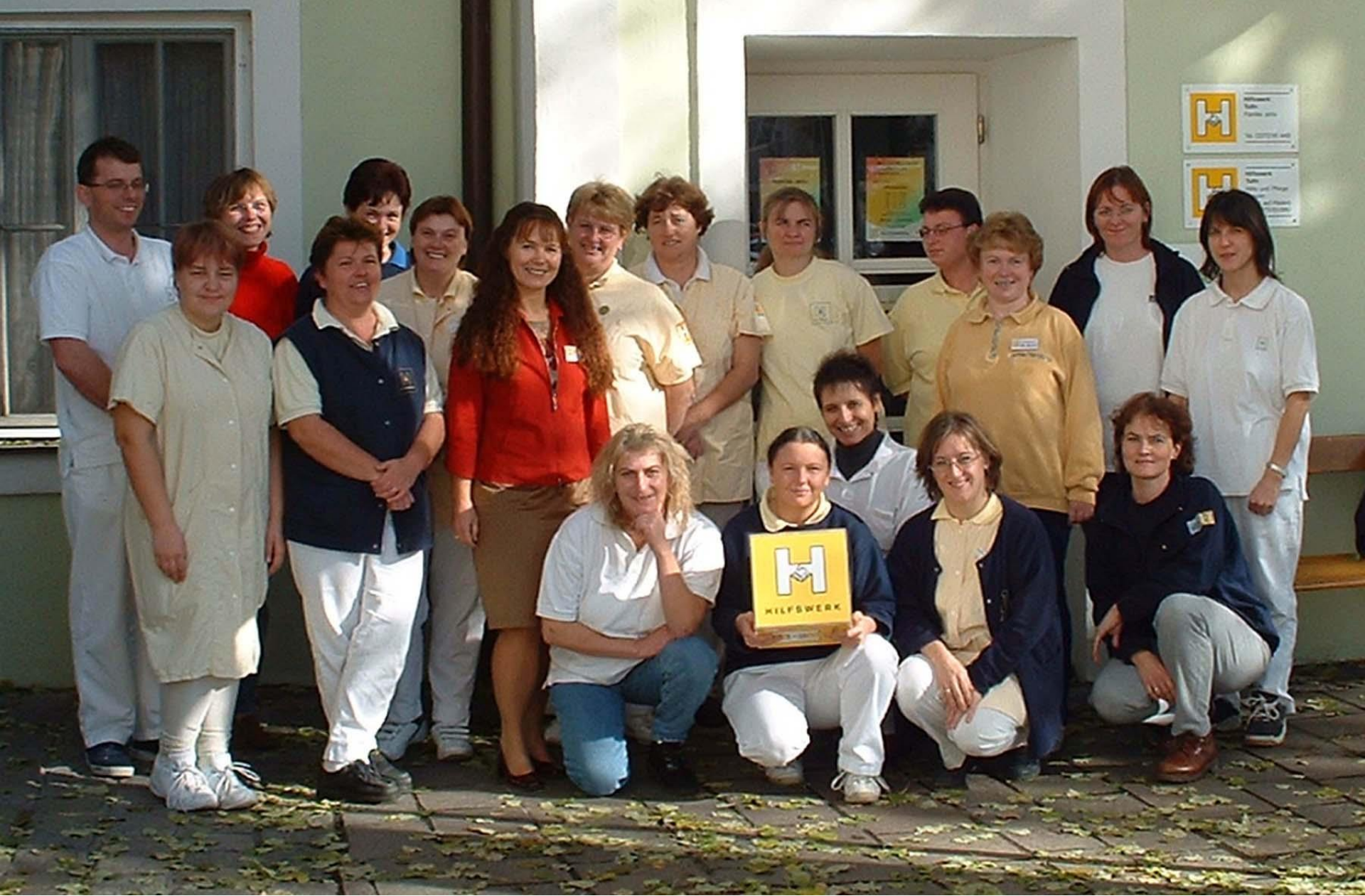
Unser Team Hilfe und Pflege daheim