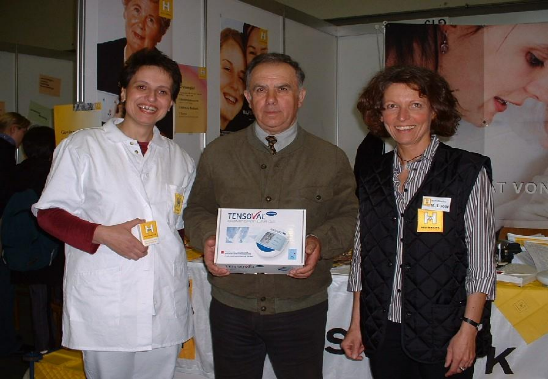
Gesundheitsmesse Tulln, Gewinner