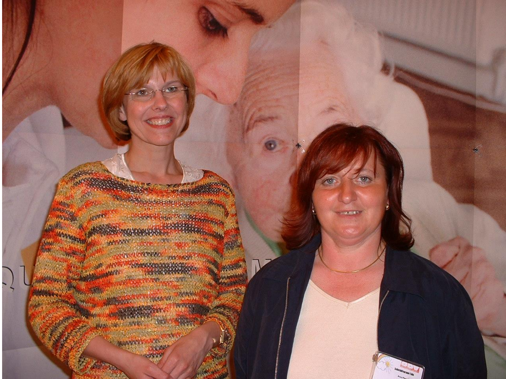
NÖ Diabetikertag in Tulln am 2. Mail 2004