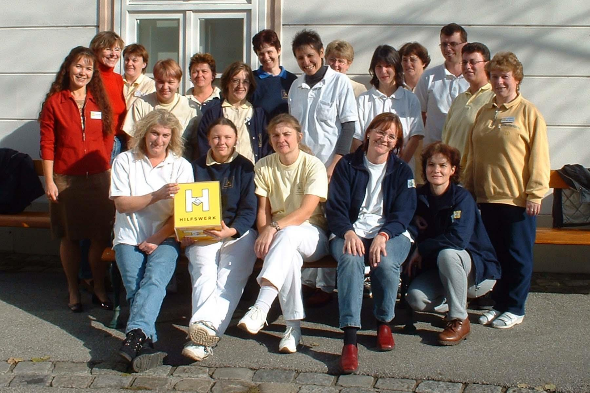
Unser Team Hilfe und Pflege daheim